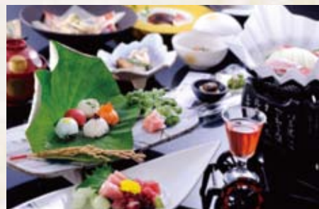
四季折々に旬の味覚をご用意いたしております。