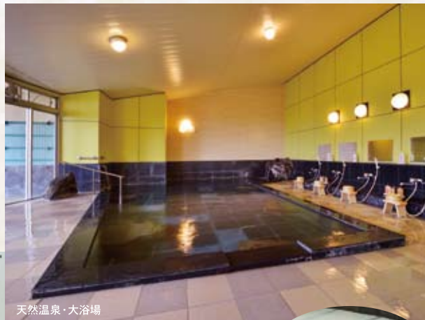
天然温泉・大浴場