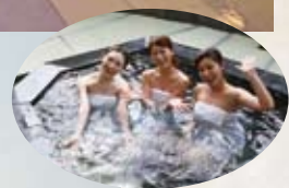
開放感溢れる露天風呂