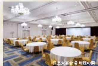
洋室大宴会場 瑞穂の間