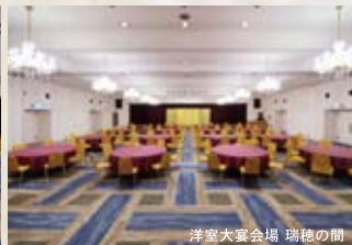
洋室大宴会場 瑞穂の間