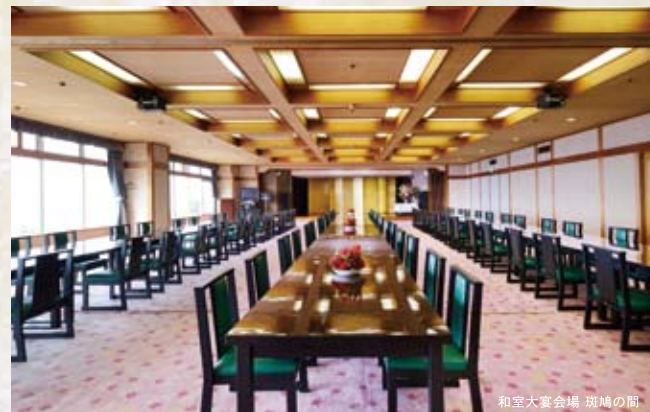
和室大宴会場 琉球の間

最上階ならではの眺望が、披露宴パーティや展示会など、さまざまなお集まりに 彩りを添えてくれます。