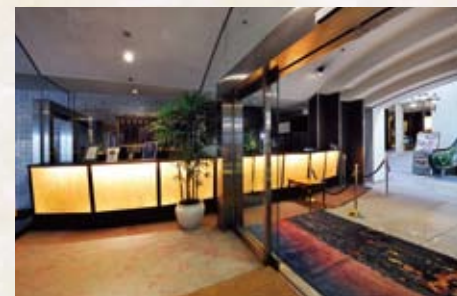
お客様をいち早くお出迎えできるよう1階入口付近にフロントを設置